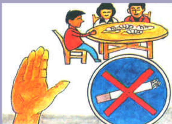
根据天气变化，注意防寒保暖；注意均衡膳食，增强自身免疫力。要少聚餐，不吸烟，少喝酒。