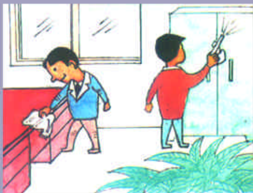
办公室工作人员要注意个人卫生，培养健康的生活习惯；保持室内用具和器材清洁。