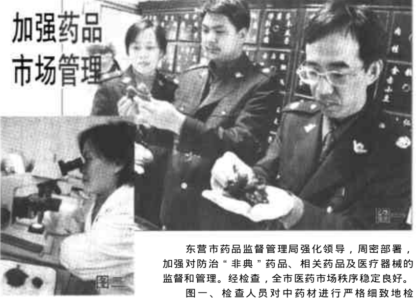
加强药品市场管理

市委加强建筑工地“非典”防治 本报讯 东营市建委积极采取应对措施，周密安排，对辖区内建筑工地非典型肺炎的防治工作进行部署。市建委要求，各县区建设(筑)主管部门要把防治工作责任层层分解落实到每一个建筑工地、每一个施工工地、每一名施工工人；各单位要研究制定现场防治工作预案，并有专门人员负责防治工作。一旦发现疑似病例，要及时送当地疾病控制机构进行检查，做到早发现、早报告、早隔离、早治疗，并采取果断措施，控制传染源，阻断传播途径，防止疫情扩散蔓延；做好重点部位的消毒工作，对施工现场、职工食堂和宿舍，要定期进行消毒，职工宿舍要经常通风，保持空气流畅。同时，尽量减少材料、设备采购人员到“非典”疫情区，确需外出的，回来后要进行必要的检查。对防治工作要加大资金投入，进一步做好职工健康教育和科普宣传工作，使广大职工增强自我保护意识。 (李炳忠 王利国)