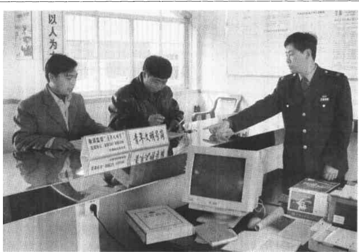
利津县丁罗镇税务局将“青年文明号”创建活动同招商引资工作紧密结合,深入开展“文明执法,诚信纳税”主题活动,受到了外地客商的一致称赞和好评。图为该局工作人员正在对前来纳税的商户进行政策指导。 (董保延 薄纯民 摄)

期间,曹连杰实地查看了胜利电化有限责任公司和顺通化工有限公司的安全生产情况,听取了东营区安全生产工作汇报。他指出,东营区地处中心城区,公众聚集场所大,人员密集,易燃易爆化工企业比较多,特别是西城区车辆多而拥挤,极易发生道路交通事故,安全生产管理难度较大,任务艰巨,务必要引起高度重视。全市各级各有关部门要进一步增强抓好安全生产工作的危机感,认真落实“一岗双责”,把安全生产工作推向深入。他强调,要突出抓好安全生产大检查。在检查方面做到抓细、抓深、抓实、抓严。抓细就是认真细致,不留死角;抓深就是有预案、有预测、有超前意识;抓实就是工作务实,重心下移;抓严就是严格要求,严格奖惩。要抓好事故隐患的整改工作。对查出的事故隐患限时整改、跟踪指导,到期未整改或拒不整改的要给予严厉处罚。曹连杰进一步指出,要严格执行安全生产目标责任制,深入开展安全生产执法年和安全生产专项整治活动。按照制订的方案,分阶段、有计划、有组织地认真实施,突出检查、督导、整改,确保取得实效。同时要抓好即将开展的安全生产月宣传工作,早部署、早安排,加大工作力度,为今年六月安全生产月各项活动的开展做好充分准备。 (刘西光 孙学江)