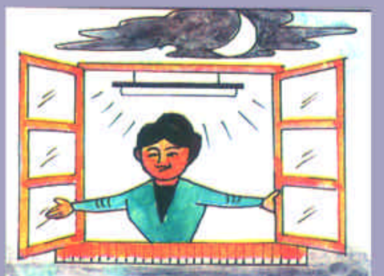
晚上睡觉前要开一段时间窗子，保持室内空气流通，保持空气清新。