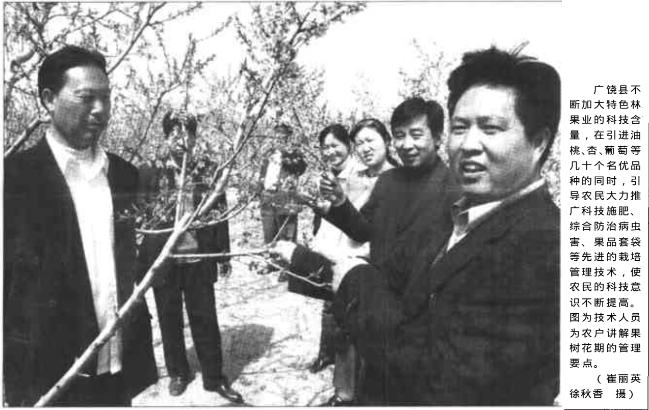
广饶县不断加大特色林果业的科技含量，在引进油桃、杏、葡萄等几十个名优品种的同时，引导农民大力推广科技施肥、综合防治病虫害、果品套袋等先进的栽培管理技术，使农民的科技意识不断提高。图为技术人员为农户讲解果树花期的管理要点。