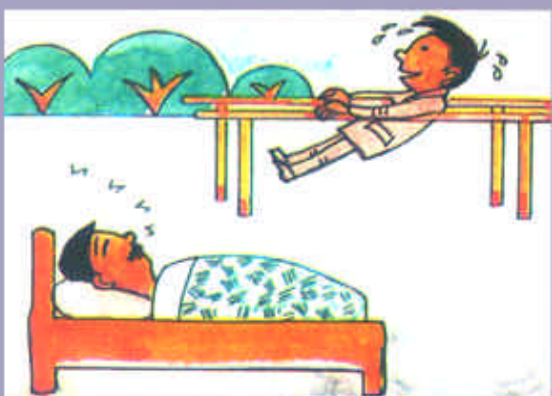
多参加一些户外活动，减少在人员密度比较大的滞留或活动时间。不过，应活动有度，注意充分休息。到空气质量好的地方去，本身就能积极减少呼吸道疾病。