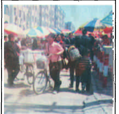
这是清风小区居民上下班、孩子上学、放学的必经之地，现在已被众多小食摊占据了，居民不经过一番周折是难以出入的。图为中午时分的现场情景。